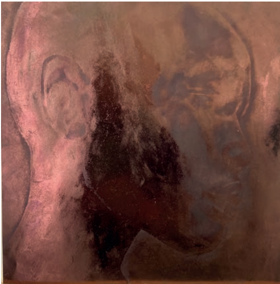
Carré magique VI, 2023

Encre huile et acylique sur papier marouflé sur toile / H 29,5 x L 23,5 cm