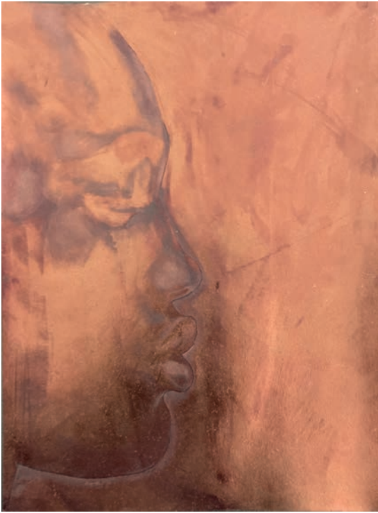
Carré magique IV, 2023

Encre huile et acylique sur papier marouflé sur toile / H 29,5 x L 23,5 cm