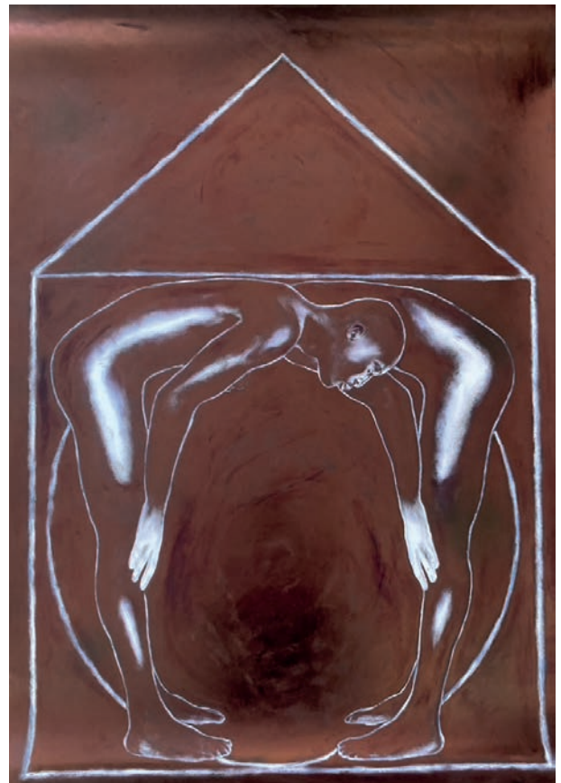
Alchimie III, 2023

Encre huile et acylique sur papier maroufflé sur toile / H 100 x L 70 cm