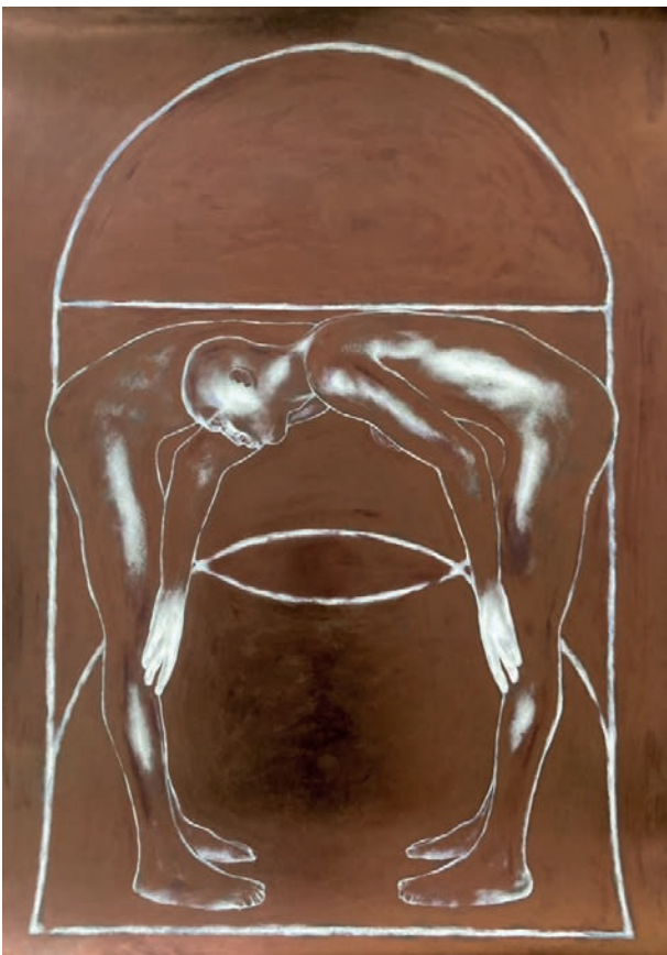
Alchimie II, 2023

Encre huile et acylique sur papier maroufflé sur toile / H 100 x L 70 cm