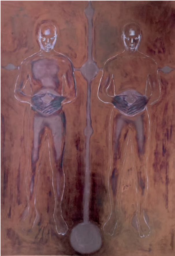
Cosmogonie IV, 2023

Encre huile et acylique sur papier maroufflé sur toile / H 100 x L 70 cm