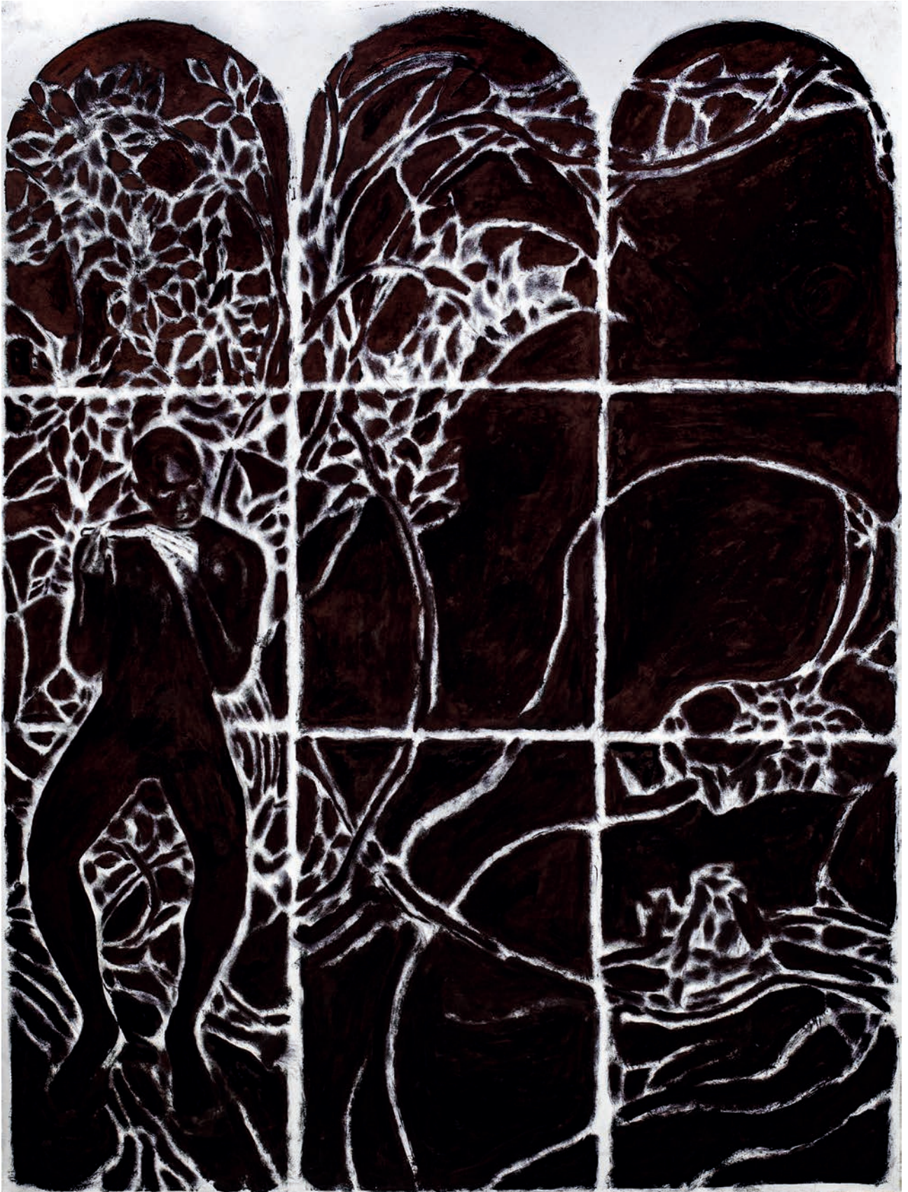
La mélodie profane, 2023

Encre huile et acylique sur papier maroufflé sur toile / H 163 x L 123 cm