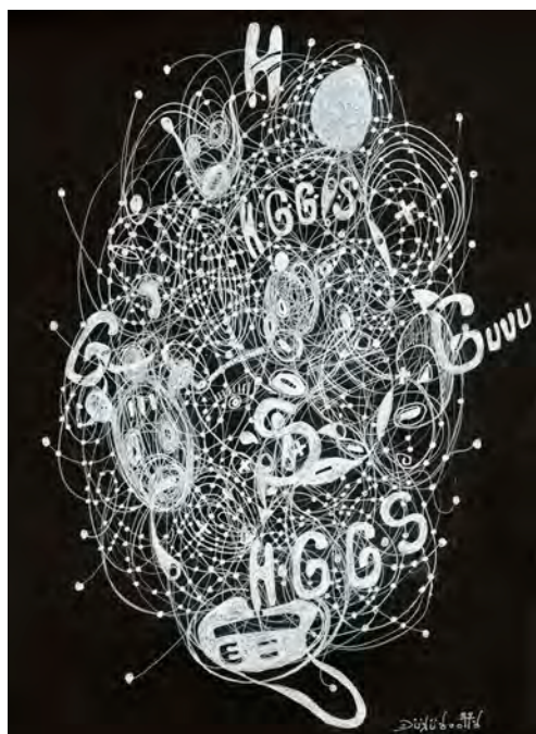
S.N.K.F @ Enigma SanKoFa Bosen, 2022