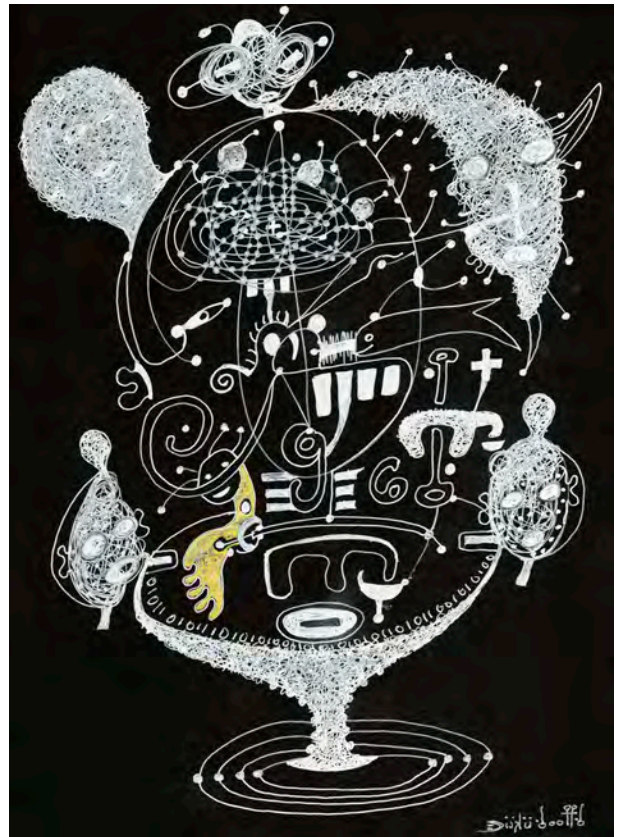
Visible invisible à l'horizon de Sirius A @ Take 1, 2022 Encre et acrylique sur papier Canson noir / 28,3 x 21 cm