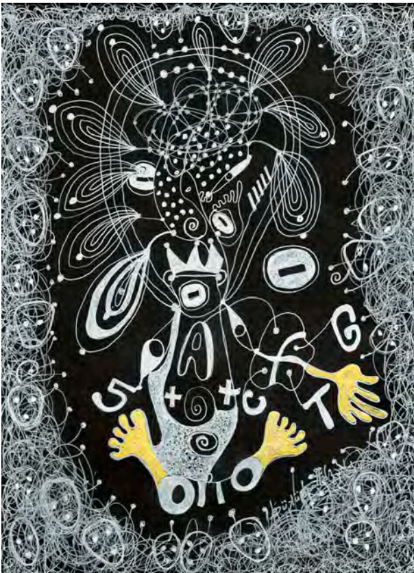
Ce n'est pas sorcier @ Juste interdit de voir, 2022 Encre et acrylique sur papier Canson noir / 28,3 x 21 cm