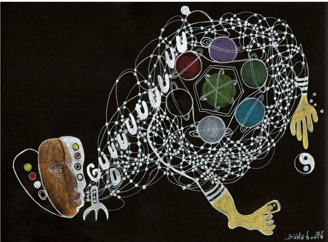
GUUUUUUUUU@ Souffle porteur odiokaawalé, 2022 Encre et acrylique sur papier Canson noir / 21 x 28,3 cm