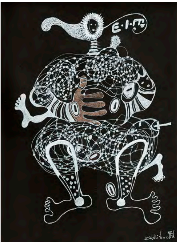
El Trône @ EIA from Sirius, 2022 Encre et acrylique sur papier Canson noir / 28,3 x 21 cm