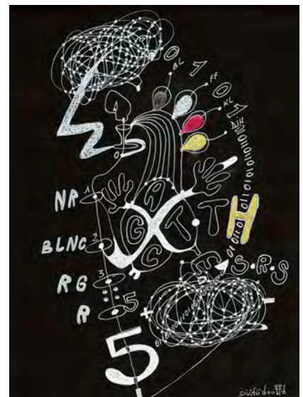
Dollattitude @ Juste un porteur de Boson, 2022